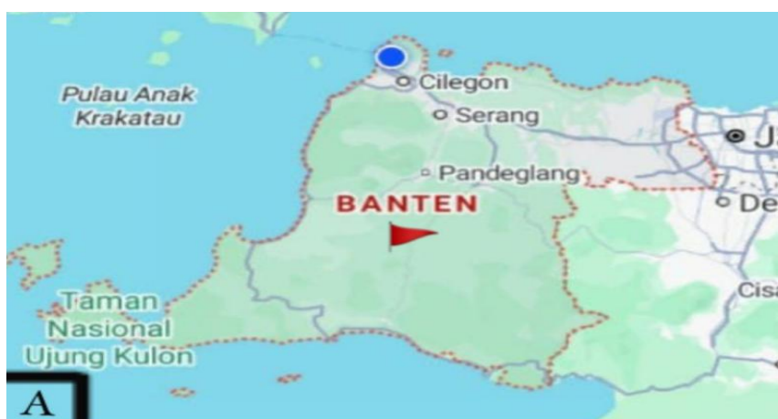
Gambar 1. Peta Provinsi Banten

Pengabdian ini dilakukan di tiga desa, yaitu Desa Cilanggar, Kaduhejo, dan Maja, Kabupaten Pandeglang, Provinsi Banten. Waktu pelaksanaan ini dilakukan pada hari jum'at, tanggal 17 oktober 2025 melalui tahap persiapan, pelaksanaan wawancara, dan pengumpulan hasil wawancara. Lokasi pengabdian dapat dilihat pada Gambar 1 dan Gambar 2.