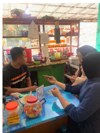
Gambar 3. Wawancara Pedagang Bakso

Setelah dilakukan wawancara meliputi pre-test, edukasi, dan post-test pelaku usaha bakso mengalami peningkatan yang signifikan. Hasil pretest yakni 50% dan post-test yakni 86% sehingga mengalami peningkatan sebesar 36%. Hal tersebut menandakan tujuan edukasi mengenai produk halal kepada pelaku usaha bakso kedua sudah tercapai.