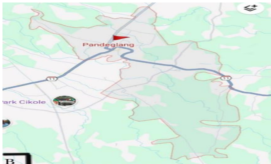
Gambar 2. Peta Kabupaten Pandeglang, Desa Cilanggar, Kaduhejo, dan Maja