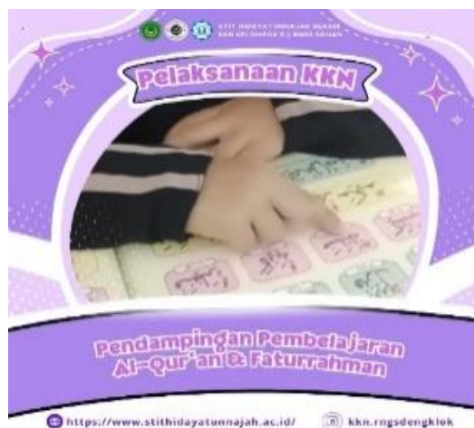
Gambar 1. Pendampingan mahasiswa dalam proses pembelajaran Qur'an menggunakan metode Nurul Bayan di salah satu TPQ

Terdapat tiga program inti dalam pengabdian ini. Pertama, penguatan pembelajaran Al-Qur'an melalui penerapan metode Nurul Bayan. Metode ini dipilih karena menekankan pada kejelasan makhraj , tajwid dasar, dan kemampuan hafalan santri. Pelaksanaan dilakukan dalam bentuk kelas kecil dengan drilling , praktik pelafalan, dan evaluasi bacaan. Modul pembelajaran dicetak oleh tim mahasiswa, dilengkapi dengan alat bantu seperti flash card hijaiyah dan audio pelafalan. Sebelum dan sesudah program, dilakukan pre-test dan post-test untuk menilai progres bacaan santri.