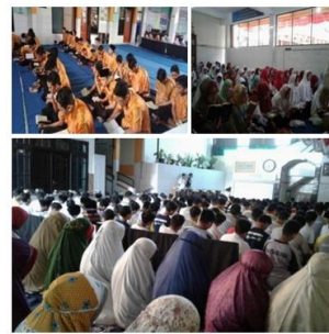
Gamabr 2 Kegiatan keagamaan

Gambar di atas merupakan hasil pengamatan dan dokumentasi yang dilakukan oleh peneliti, menegaskan bahwa full day school yang diterapkan di MTS Surya Buana Dinoyo Kota Malang bagus karena memiliki berbagai program unggulan, di bidang akademik yang sudah menorehkan berbagai prestasi baik di tingkat kota maupun internasional seperti yang diraih oleh