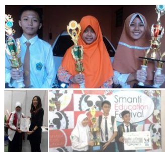
Gambar 1 Prestasi Akademik Nasional dan Internasional

Berdasarkan diagram 1 melalui wawancara yang dilakukan oleh peneliti terhadap kepala sekolah, guru bimbingan dan koseling, guru pendidikan agama islam dan siswa Menunjukkan bahwa MTS Surya Buana Dinoyo Kota Malang dalam menerapkan full day school dengan baik. Dalam penerapan full day school , sekolah telah melaksanakan pembiasaan atau kegiatan rutin dalam bidang akademik dan karakter seperti; (Konsetrasi belajarnya baik, melaksanakan program akademiknya baik, menjalin komunikasi dengan guru dan teman baik, melaksanakan kegiatan keagamaannya baik, kepedulian sosialnya baik, menjaga kebersihan sekolahnya baik dan penerapan hidup jujurnya juga baik) pada siswa selama berada di sekolah itu menunjukkan bahwa penerapan full day school mendapatkan dapat meningkatkan prestasi akademik dan karakter religius.