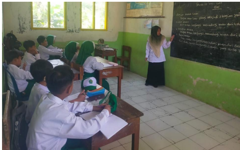
Gambar 1. Storytelling Sebagai Strategi Inovatif Dalam Pembelajaran

Dengan demikian, storytelling terbukti menjadi strategi inovatif yang efektif dalam membantu pembentukan karakter religius siswa MI Darun Najah Tiris Probolinggo, sekaligus meningkatkan pemahaman materi PAI dan motivasi belajar seperti gambar berikut: