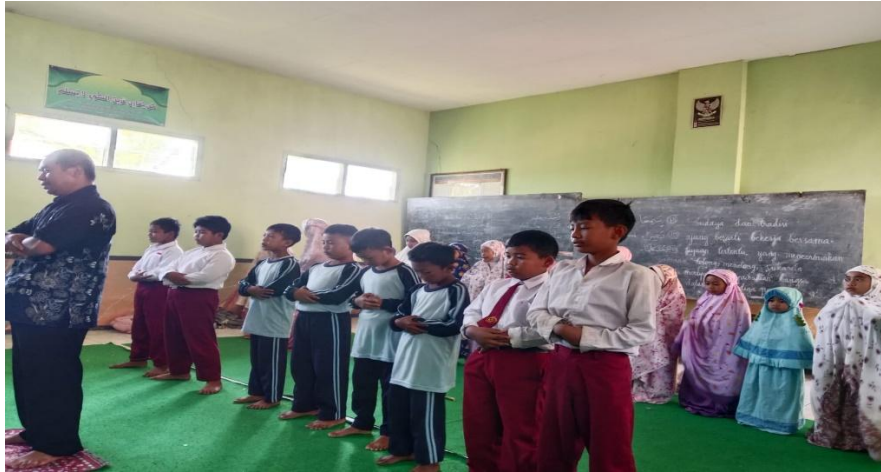
Gambar 1. Kegiatan shalat Dhuha di SDN Kalianan II Krucil Probolinggo

Gambar 1 diatas merupakan kegiatan shalat dhuha di SDN Kalianan II Krucil Probolinggo merupakan program pembiasaan keagamaan yang dirancang secara terstruktur oleh pihak sekolah sebagai bagian dari implementasi Pendidikan Agama Islam (PAI). Kegiatan ini dilaksanakan setiap pagi sebelum proses belajar mengajar dimulai, biasanya setelah apel pagi. Seluruh siswa diarahkan menuju mushalla sekolah dengan tertib dan dipandu langsung oleh guru PAI beserta guru kelas.