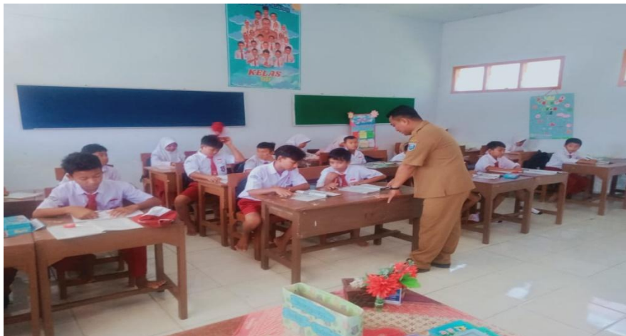
Gambar 1. Pendekatan kolaboratif Think-Pair-Share

Pernyataan ini mengindikasikan bahwa metode pembelajaran kolaboratif meningkatkan pemahaman nilai keislaman secara lebih bermakna dan aplikatif karena siswa terlibat aktif dalam berbagi pengalaman dan refleksi bersama teman sekelas. Pernyataan di atas diperkuat oleh hasil observasi dan dokumentasi berupa gambar berikut: