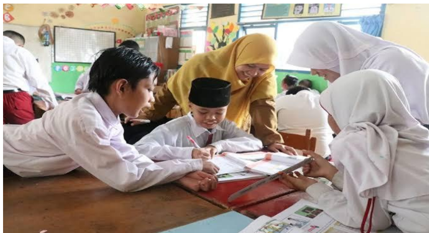
Gambar 1. Penerapan strategi pembelajaran analitis dan inovatif

Gambar ini menunjukkan suasana pembelajaran PAI dan Bahasa Arab di SDI Raudlatul Istiqomah Kecamatan Maron Probolinggo. Terlihat siswa terbagi dalam beberapa kelompok untuk melaksanakan project based learning, di mana mereka menyusun peta konsep Al-Qur'an dan membuat dialog Bahasa Arab sesuai topik yang diberikan guru. Beberapa siswa terlihat aktif mendiskusikan makna ayat dan kosa kata, menulis ide pada kertas atau papan tulis, serta menyajikan hasil proyek secara bergantian di depan kelas.