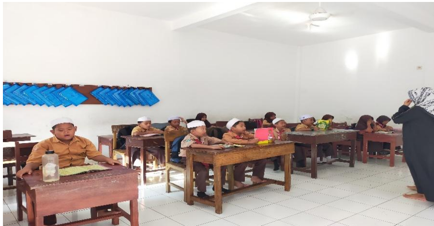
Gambar 1. Hafalan Juz Amma dikelas II Madrasah Ibtidaiyah Khalafiyah Syafi'iyah Zainul Hasan Genggong Pajarakan

Dalam konteks penelitian ini, keterlibatan guru dalam membimbing hafalan secara bertahap, memberikan penjelasan makna ayat, dan melakukan evaluasi rutin berfungsi sebagai bentuk scaffolding , membantu siswa mencapai pemahaman yang lebih tinggi daripada jika belajar sendiri. Motivasi siswa, dukungan lingkungan belajar, serta konsistensi pengulangan berperan sebagai kondisi yang mendukung scaffolding agar siswa dapat belajar secara efektif dan bermakna. 26 Data diatas diperkuat oleh hasil observasi dan dokumentasi berikut ini: