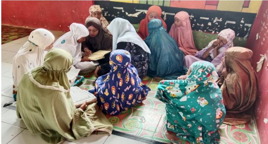
Gambar 2. Kegiatan Ekstrakurikuler Tahfidz Al-Qur'an Kelas IV khusus Putri

Gambar 2 menunjukkan kegiatan ekstrakurikuler Tahfidz Al-Qur'an untuk siswa putri kelas IV di SDN Kalianan Krucil dirancang secara khusus dan terstruktur agar mendukung perkembangan hafalan Al-Qur'an sekaligus membentuk karakter disiplin dan mandiri. Kegiatan ini dilaksanakan setiap minggu setelah jam pelajaran utama dengan durasi yang disesuaikan, sehingga siswa tetap fokus tanpa merasa terbebani.