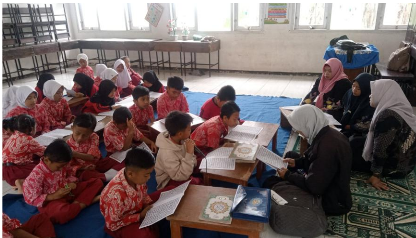
Gambar 1. Kegiatan Ekstrakurikuler Tahfidz Al-Qur'an Kelas IV

Kegiatan ekstrakurikuler Tahfidz Al-Qur'an di SDN Kalianan Kec. Krucil tidak hanya menekankan hafalan, tetapi juga membentuk self-regulation siswa melalui empat aspek utama: perencanaan, pengendalian diri, monitoring, dan evaluasi. Guru dan penanggung jawab secara konsisten membimbing siswa untuk merencanakan target hafalan, mengontrol proses belajar, memantau kemajuan, dan mengevaluasi hasil hafalan. Siswa menunjukkan kemampuan menerapkan strategi belajar mandiri, memperbaiki kesalahan, dan tetap fokus pada target, sementara orang tua memperkuat konsistensi belajar di rumah. Data wawancara diatas diperkuat oleh hasil observasi dan dokumentasi berikut ini: