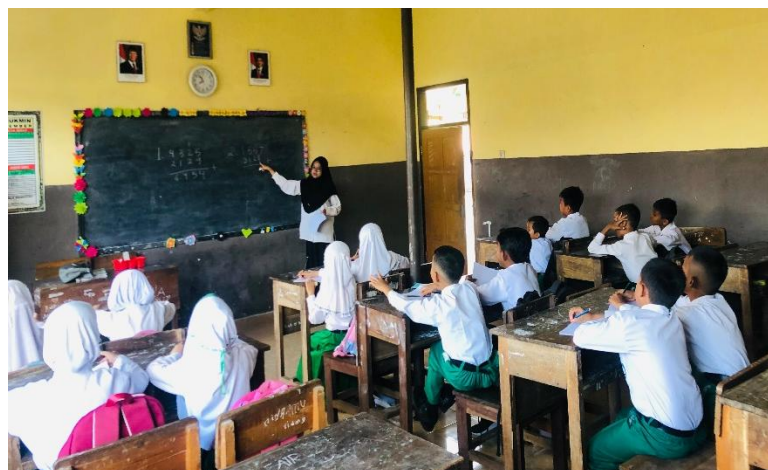
Gambar 1. Suasana pembelajaran dengan metode persuasif yang kondusif

Berdasarkan ketiga teori di atas, dapat dipahami bahwa kenakalan siswa di sekolah dasar bukanlah fenomena tunggal, melainkan hasil interaksi antara lingkungan keluarga, teman sebaya, dan sekolah (Bronfenbrenner). Guru PAI berperan penting dalam membentuk disiplin melalui reinforcement (Skinner) dan pembinaan karakter Islami (Lickona). Dengan demikian, upaya penanganan kenakalan siswa perlu dilakukan secara integratif, melibatkan guru, keluarga, dan lingkungan sosial. Hasil data observasi dan dokumentasi seperti gambar berikut ini: