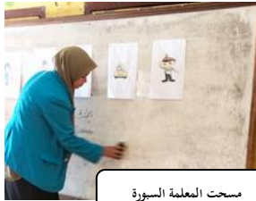
مسحت المعلمة السبورة