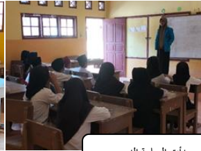
بدأت المعلمة الدرس