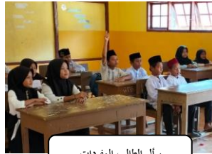
سأل الطالب المفردات