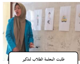
طلبت المعلمة الطلاب لتذكير