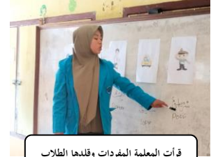
قرأت المعلمة المفردات وقلدها الطلاب

تم تطوير طريقة التقليد - التحفيز أولاً للأفراد العسكريين خلال الحرب العالمية الثانية. كانت هذه الطريقة ناجحة بسبب الدافع العالي والممارسة المكثفة والفصول الصغيرة والنماذج الجيدة. يتم حفظ بعض الجمل الأساسية عن طريق التقليد. عندما يتم تعلم الجمل الأساسية بشكل مفرط، يمكن للطلاب ممارسة الحوار. ثم يمكنهم تغيير الحوارات داخل المواد التي تعلمها بالفعل. وأخيراً، يقوم الطلاب بتمثيل الحوار أمام الطلاب. 20