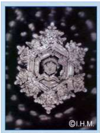
Power of Prayer