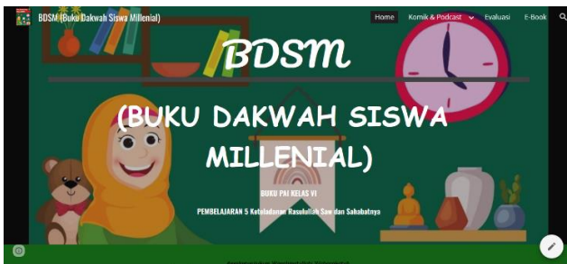
Gambar 1. Menu home pada website