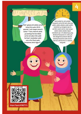
Gambar 3. Penutup pematerian pada setiap episode disertai dengan barcode