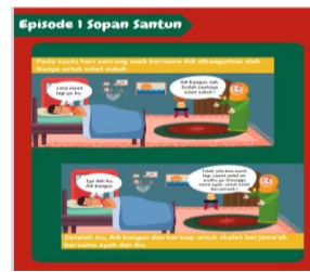
Gambar 2. Tampilan pematerian setiap episode pada e-book