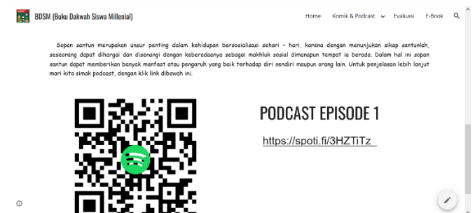
Gambar 4. Barcode dan link podcast