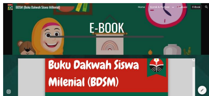
Gambar 6. E-book yang lengkap