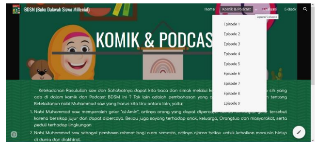
Gambar 2. Menu komik dan podcast pada website