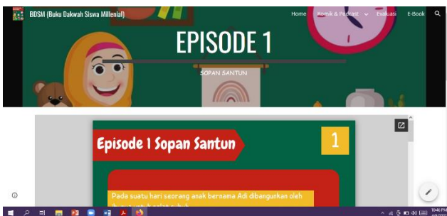
Gambar 3. Submenu pada komik dan podcast