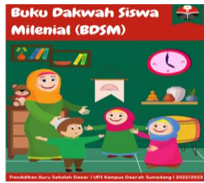
Gambar 1. Cover BDSM