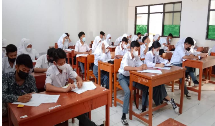
Gambar 3. Penilaian Formatif

Gambar 3, pendidik melakukan penilaian posttest untuk menguji pengetahuan peserta didik setelah mengikuti pembelajaran, tujuannya untuk mengetahui ketercapaian kemampuan berpikir peserta didik setelah mengikuti KBM.