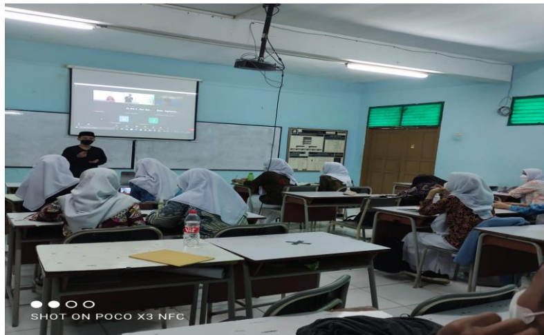
Gambar 2. Penggunaan Metode Eklektik dalam Pembelajaran oleh GPAI

Gambar 2, pendidik menyampaikan materi beriman kepada hari akhir dengan menggunakan metode ceramah kemudian dilanjutkan dengan diskusi dan tanya jawab.