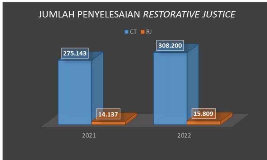
Gambar 1 Jumlah Perkara yang Diselesaikan Melalui Mekanisme Restorative Justice oleh Bareskrim Polri Selama Periode 2020 dan 2021. 10

Menariknya, kasus hukum di tingkat kejaksaan ini justru diselesaikan melalui mekanisme restorative justice. Mekanisme penyelesaian tindak pidana alternatif di tingkat kejaksaan diatur oleh Peraturan Kejaksaan Nomor 15 Tahun 2020 tentang Penghentian Penuntutan Berdasarkan Keadilan Restoratif. Tercatat sejak tahun 2020 sampai dengan awal bulan Maret tahun 2022 lebih dari 823 kasus telah diselesaikan oleh pihak Kejaksaan Agung melalui mekanisme restorative justice atau keadilan restoratif. 11 Per 17 November 2022, kejaksaan telah menyelesaikan total 1.866 kasus melalui mekanisme restorative justice.