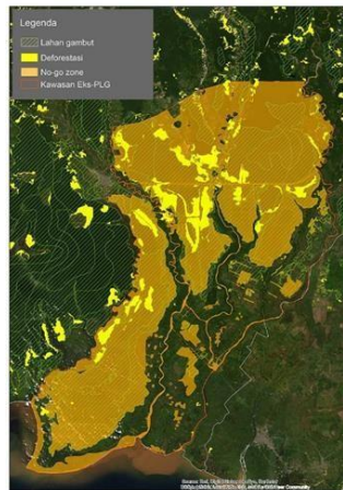
Peta Penyediaan Lahan Food Estate Kalimantan Tengah